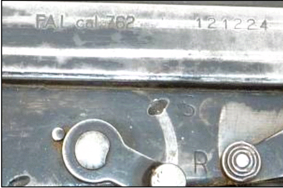
Figure 2: exemple de marquage individuel sur une arme

Le Rapport national de la Belgique pour 2010 sur l'application du Programme d'Action des Nations Unies en vue de prévenir, combattre et éliminer le commerce illicite des armes légères sous tous ses aspects 1 mentionne: